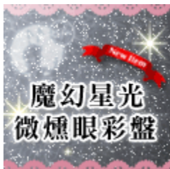
MuGu魔幻微燻眼影盤 特價$199