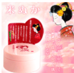
京都舞妓美肌透亮乳霜 特價$260